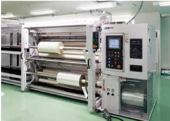
クリーンルーム クラス7 プラスチックフィルムスリッター

プラスチックフィルムスリットはISO14644-1(JIS B9920)に規定されている空気清浄度評価クラス7、コロナ処理はクラス8のクリーンルーム内で加工しています。