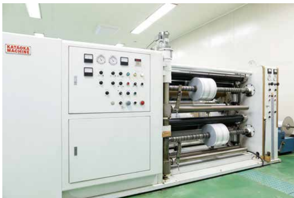
プラスチックフィルムスリッター

清浄度クラス8のクリーンルームでISO9001に基づき、機械の適性に合わせて製造されたフィルムを用いてスピーディかつ安全に包装することができます。先進のオートメーション化に対応できる体制づくりに取り組んでいます。