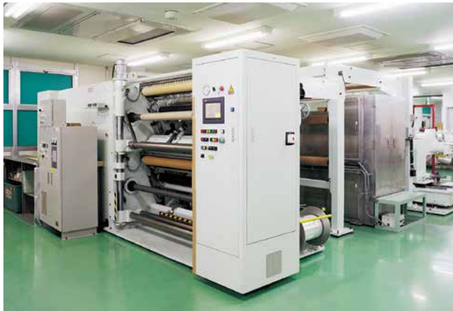
クリーンルーム クラス8 コロナ処理 プラスチックフィルムスリッター

プラスチックフィルムスリットはISO14644-1(JIS B9920)に規定されている空気清浄度評価クラス7、コロナ処理はクラス8のクリーンルーム内で加工しています。