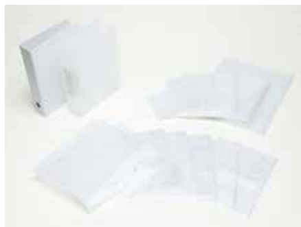
ホルダー、ファイル、バインダー

海外生産品においてはAQL検査（MIL-STD-105Eに基づく）を実施し、安心してご利用いただける製品をご提供できるよう徹底管理しております。