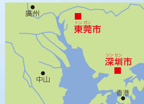
●中国関連企業 八光大樹貿易有限公司